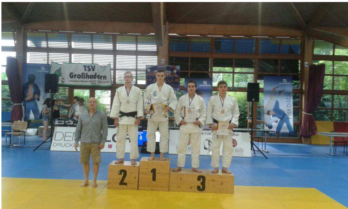
Siegerehrung der 66 kg Gewichtsklasse

Herzlichen Glückwunsch zu diesem tollen Ergebnis!