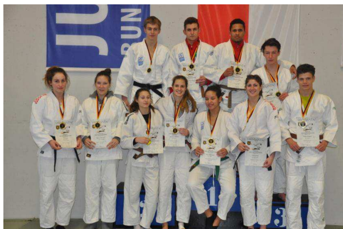
Die Pfalzmeister/innen der Altersklasse U 21